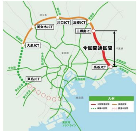
外環道マップ

また、震災などの災害時における避難路や緊急輸送路、火災時の延焼防止の機能として期待できます。物流の生産性向上、広域的な観光交流の促進だけでなく、地域の安全性の向上に貢献できます。首都圏全体の生産性を高めるネットワークとして、今後さらに整備されることが期待されます。