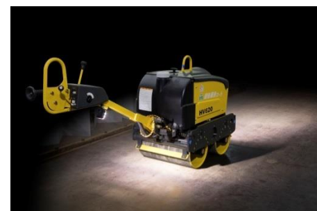
足元灯オプション

この足元灯オプションは、サカイのハンドガイドローラ全機種にオプション設定しておりますので、是非ご検討ください。