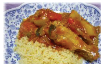
チュニジアの代表料理クスクス （世界一小さいパスタ）

紀元前、北アフリカに暮らすベルベル人の料理（クスクス等）に、フェニキア人がカルタゴを建設してオリエントの文化を持ち込みました。その後、ローマ人は地中海文化を、アラブ人は総合的なイスラム文化を持ち込み、チュニジア料理に変化をもたらしました。さらに、その後、オスマントルコがペルシャ料理の影響を受けた宮廷料理を、レコンキスタ（外国からチュニジアに帰省した人）とアンダルース人はイベリア半島の料理を、近年では、フランス人が総合的な食文化を持ち込んでいます。