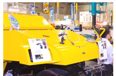
赤外線式放射温度計