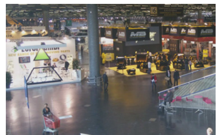
屋内展示場の状況