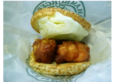
チャイニーズチキンバーガー