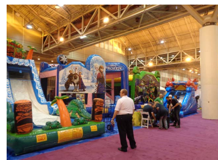
エア遊具なども出展