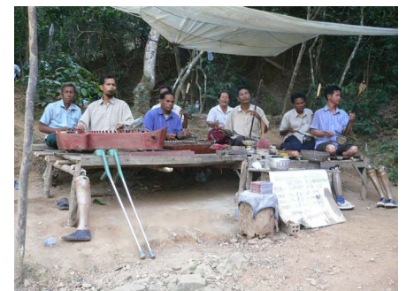
写真2 道端で演奏をしている人達

1970年から約30年に及ぶ内戦中に、紛争4派（政府軍、クメール・ルージュ、シハヌーク派、ソン・サン）によってカンボジアには大量の地雷が埋設され、世界で最も地雷埋設密度の高い国と言われています。また、現在地雷と同程度の被害を出している不発弾は、米軍によってベトナム戦争の際にベトナム領土だけでなくラオス、カンボジアにも大量に落とされ、現在でも大きな被害を及ぼしています。