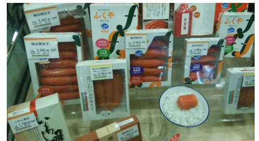
店頭に並ぶ辛子明太子