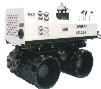
SA33L2 : トレンチローラ