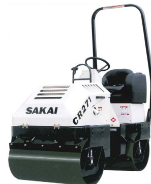
CR271 : タンデム振動ローラ