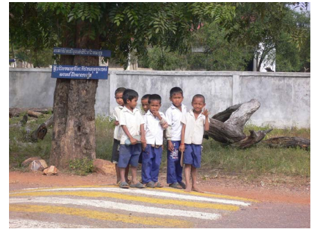
写真1 こちらに手を振る小学生

カンボジアのアンコール遺跡群を訪れる際、私はバイクタクシーを利用してあちこち見て回りました。田舎の方へ出かける事もありましたが、その際、小学校の前を通ると、小学生達がこちらに気付き手を振ってきました（写真1）。カンボジアではこの様に小学生くらいの子供がとてもフレンドリーに手を振ってくれる事が多々あり、とても嬉しくなりました。