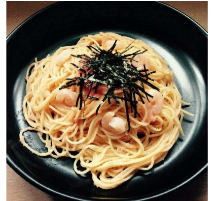
辛子明太子スパゲッティ